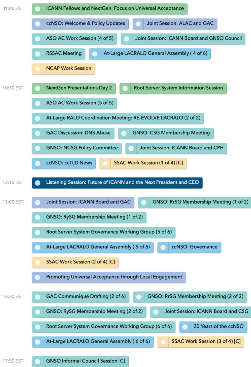
圖 8. ICANN 76 3 月 14 日各場次