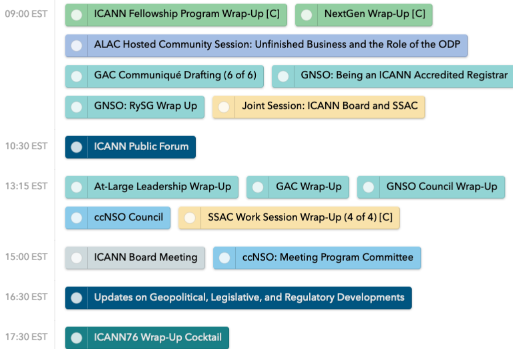
圖 10. ICANN 76 3 月 15 日各場次