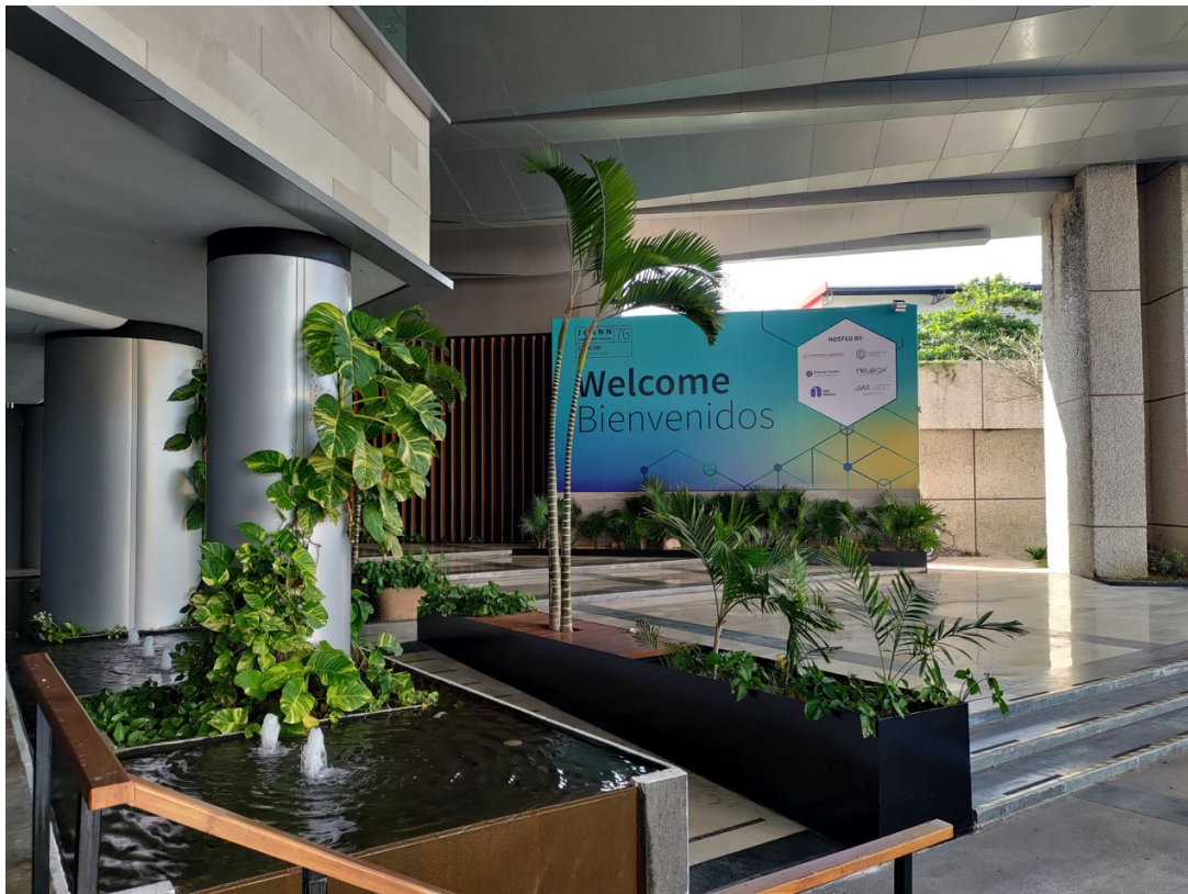
圖 1. ICANN 76 於 3 月 11 日正式假坎昆會議中心舉行

ICANN 76 Cancun Meetings 會議在 3 月 11 日正式假墨西哥坎昆會議中心舉行，本次會議是網際網路名稱與號碼指配組織（Internet Corporation for Assigned Names and Numbers，ICANN）在 2023 年辦理的第一次實體會議，以社群論壇（Community Forum）形式辦理，採取實體/線上混合模式進行。