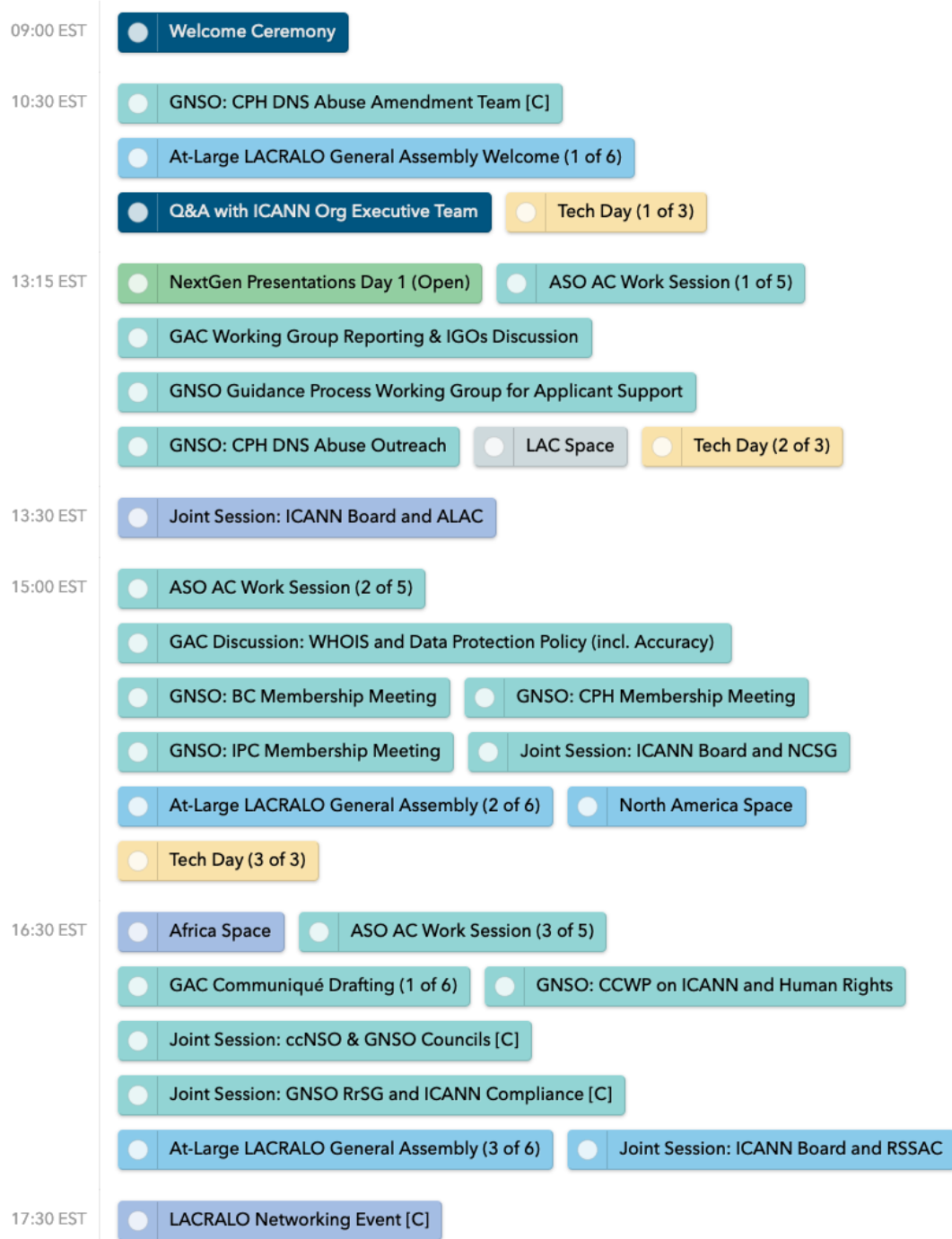
圖 7. ICANN 76 3 月 13 日各場次