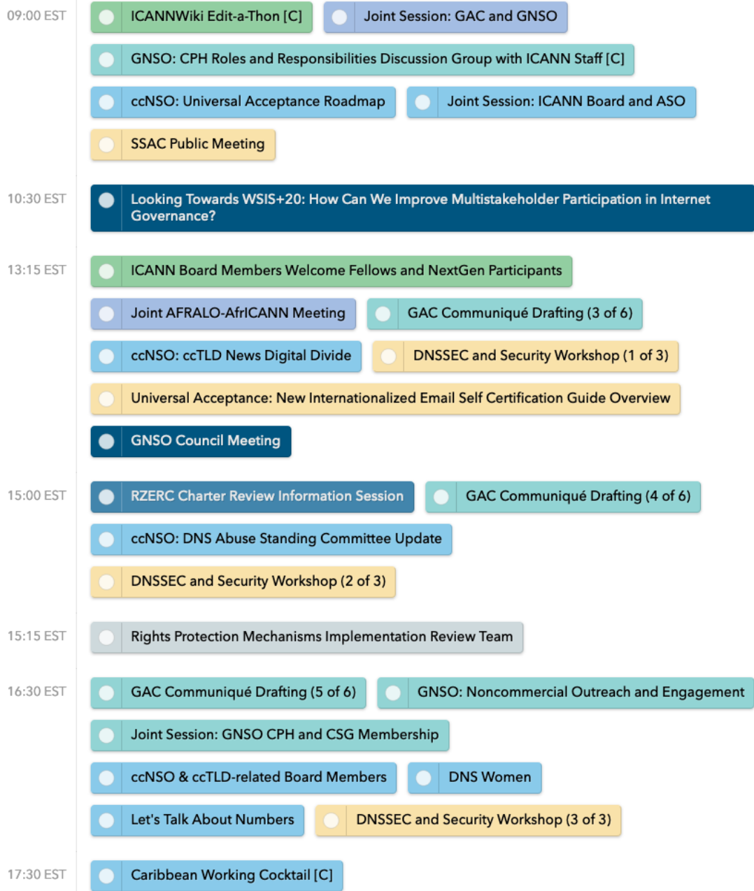
圖 9. ICANN 76 3月15日各場次